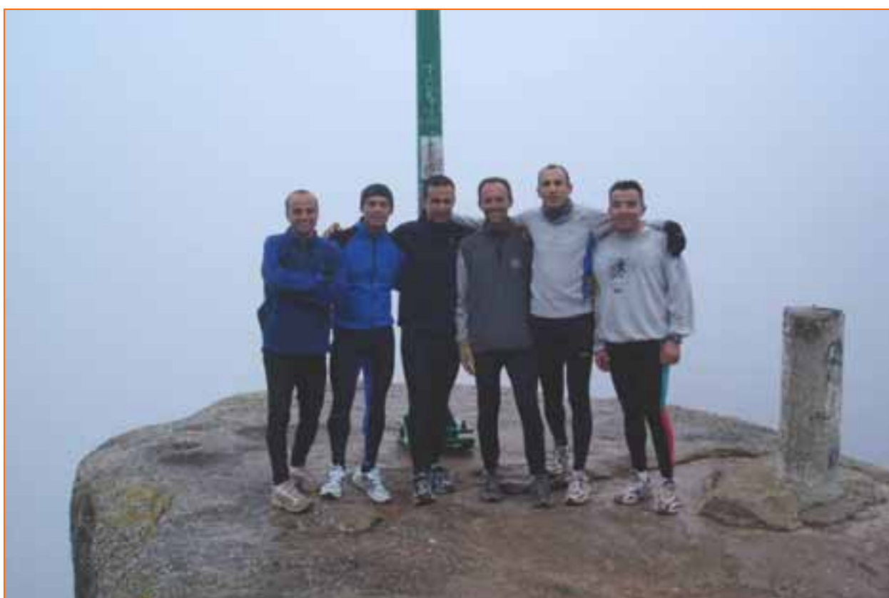
Un grup d'atletes i triatletes del CAM dalt de tot del cim del Collbaix, després de l'ascensió a peu. La pujada al Collbaix es va repetir malgrat les dificultats del camí. Dia 25 de desembre de 2004.