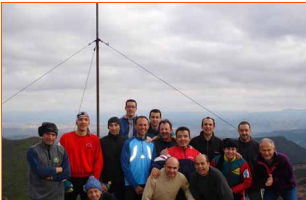
Els atletes veterans del Club Atlètic Manresa al cim del Cogulló, el 12 de desembre de 2004.